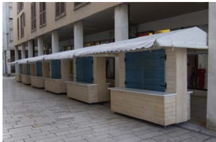
Izgled novih štandova

Među brojnim aktivnostima, valja izdvojiti inicijativu za izradu unificiranih štandova za prigodnu ljetnu prodaju. U suradnji s Gradskom upravom izrada i osmišljavanje štandova povjereni su Nevenu Stojakoviću, a nakon odobravanja idejnog rješenja, prihvaćen je štand «Mediteran» kao jedinstveni štand za ljetnu prodaju na prostoru Foruma. Zahvaljujući ovoj inicijativi javnost je po prvi put pozitivno ocijenila izgled ljetne prodaje na otvorenom, a sami korisnici su na zadovoljavajući način riješili probleme skladištenja i izlaganja robe.