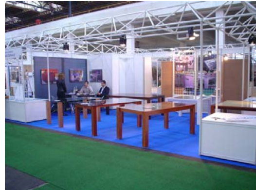
S međunarodnog obrtničkog sajma u Zagrebu, 2004. godine