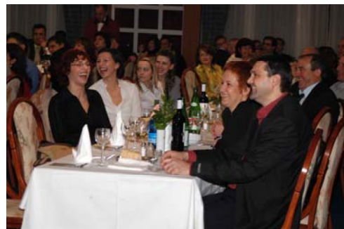
Noć obrtnika – „Vrijeme za ples...“