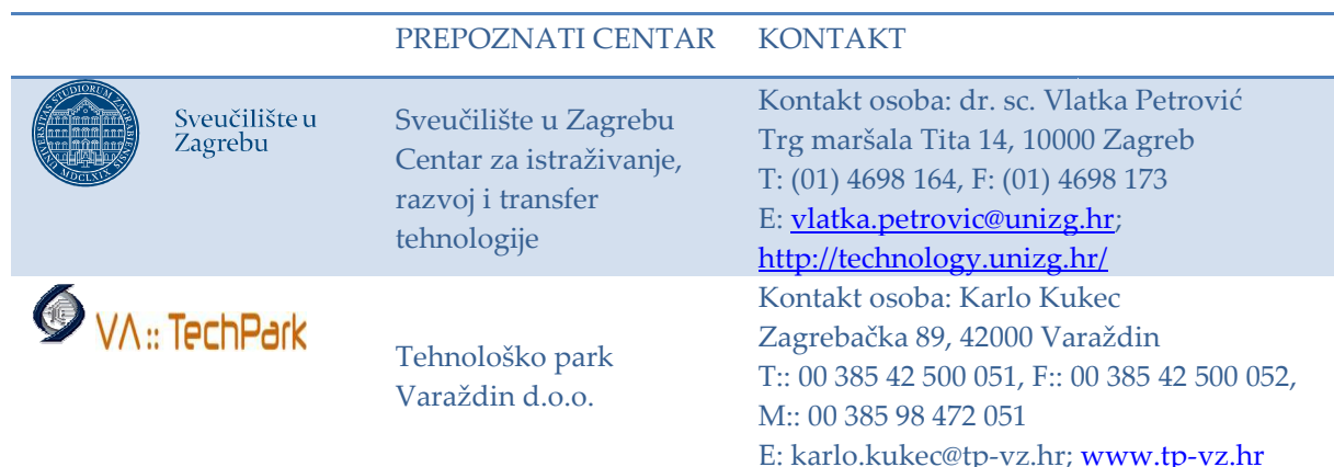
Slika 1. Popis prepoznatih centara za provedbu PoC-a (adrese i kontakti)

BICRO ima za sada sklopljen Sporazum o međusobnim pravima i obvezama vezano uz provedbu Programa sa šest Prepoznatih centara, koji se navode ispod, s tendencijom širenja i povećanja broja Prepoznatih centara kako bi se natjecateljima omogućio što lakši, kraći i jednostavniji put od prijavljivanja do realizacije projekata.